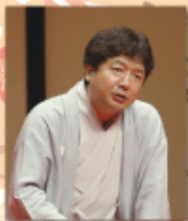
金原亭世之介 (第2回興行ゲスト)