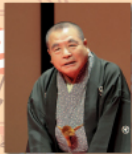
蝶花楼馬楽 (第4回興行ゲスト)

鹿芝居とは断家が集まってお芝居をする昔から盛んに行われてきた断家芝居のこと。馬生二門と馬生ハマ寄席歴代のゲスト師匠達による落語と鹿芝居。何とも豪華企画の特別公演！お楽しみ！