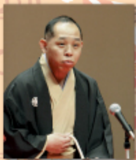
古今亭菊春 (第1回興行ゲスト)